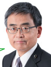
県議会議員 藤井かつひこ